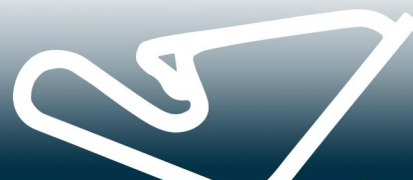
Circuit de Lessay-Manche

LONGUEUR: 937 MÈTRES LARGEUR: 12-16 MÈTRES LIGNE DROITE DE DÉPART: 152 MÈTRES TERRE: 38% ASPHALTE: 62%